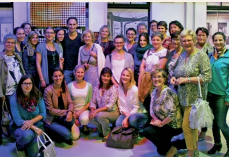
Abgerundet wurde der Abend mit einem Gruppenfoto mit dem Comedian.

Ein herzliches Dankeschön gilt abermals der Chefin, die jedes Jahr aufs Neue diesen Tag ermöglicht!