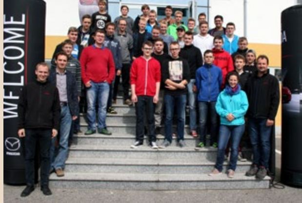
Lehrlingsevent am Wachauring

Es ist viel passiert und viel über unsere Lehrlinge berichtet worden. Ein Zeichen, dass wir uns auf dem richtigen Weg